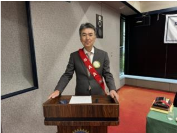
中世 吉昭 S・A・A