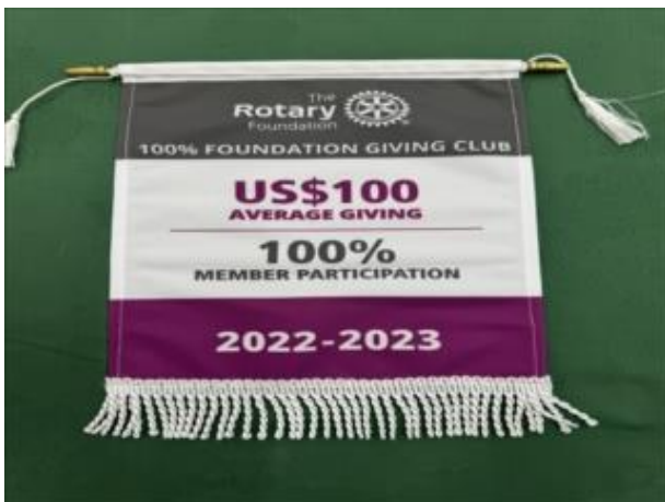
100%ロータリー財団寄付クラブ