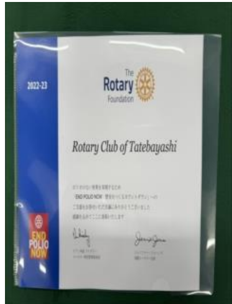
「End Polio Now : 歴史をつくるカウントダウン」 感謝状