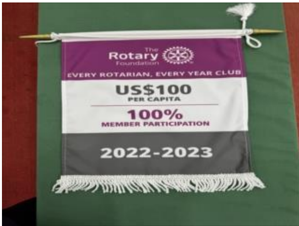
「Every Rotarian, Every Year」クラブ