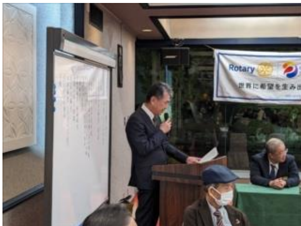
中世 吉昭 S・A・A