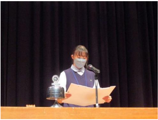
桐生第一高等学校