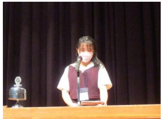
共愛学園高等学校