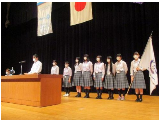
群馬県立大間々高等学校