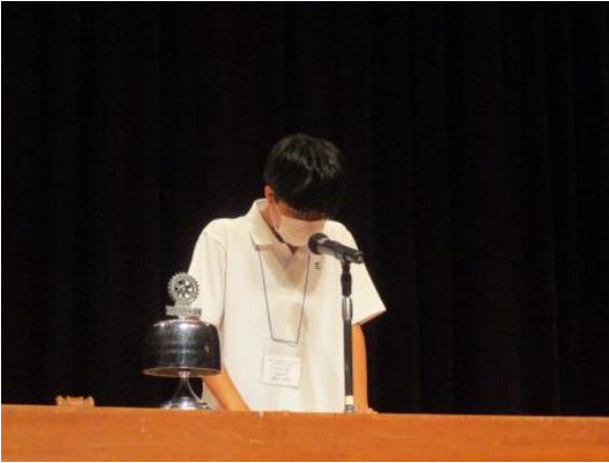
群馬県立館林高等学校