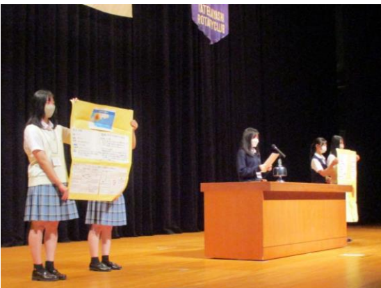
高崎健康福祉大学高崎高等学校