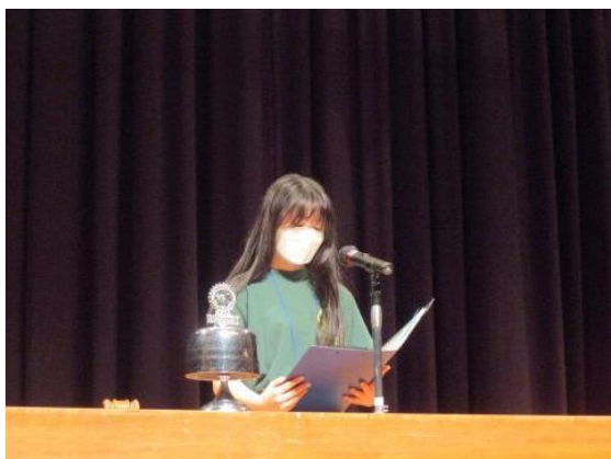
クラーク記念国際高等学校 前橋キャンパス