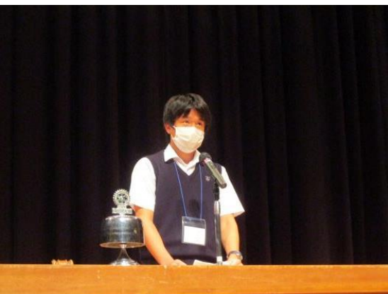
伊勢崎市立四ツ葉学園中等教育学校