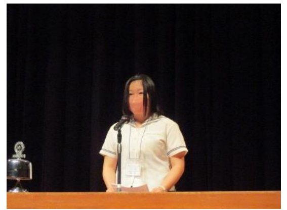
高崎商科大学附属高等学校