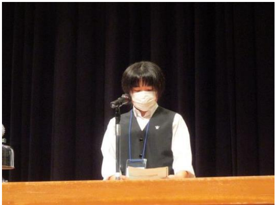
群馬県立前橋商業高等学校