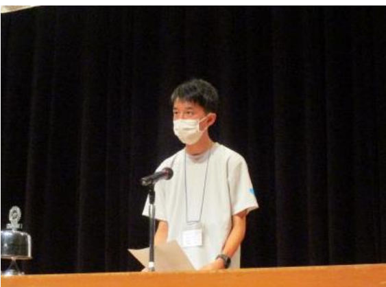
高崎市立高崎経済大学付属高等学校