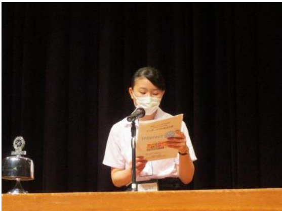
新島学園高等学校