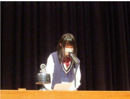
前橋育英高等学校