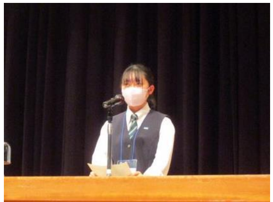
太田市立太田高等学校