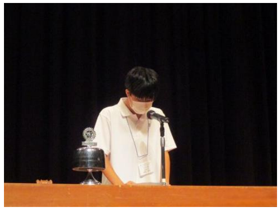
群馬県立藤岡中央高等学校