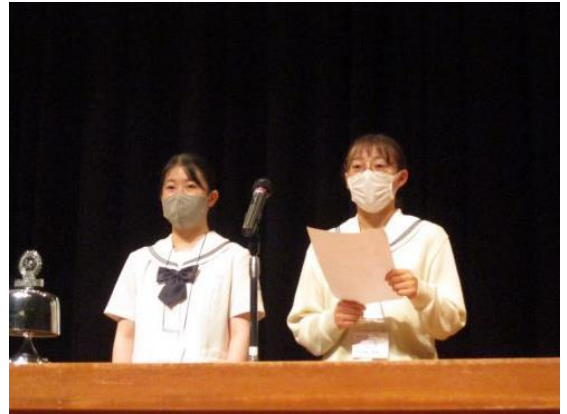
明照学園 樹徳高等学校