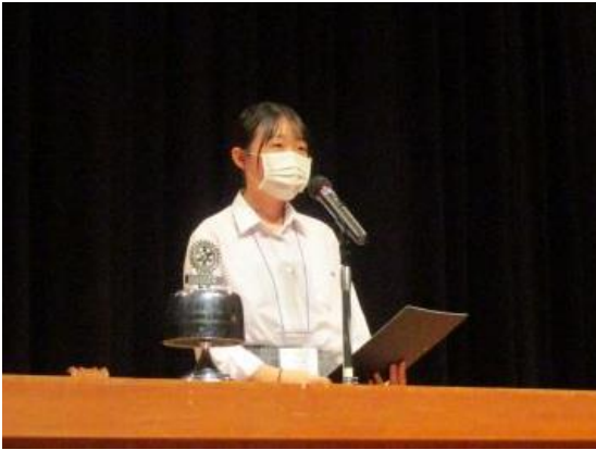
群馬県立大間々高等学校