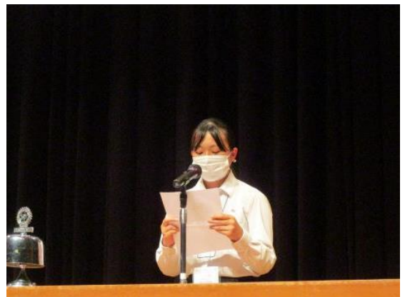
利根沼田学校組合立利根商業高等学校