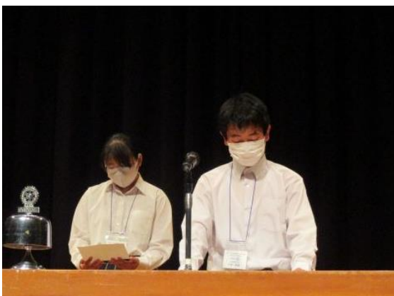
群馬県立新田暁高等学校