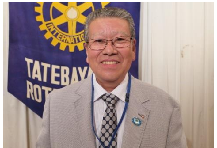
国際ロータリー第2840地区