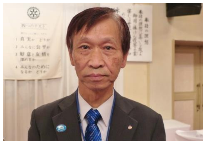
館林ミレニアムロータリークラブ会長

ロータリーでもそれぞれの事業所においても、今までの常識や慣習にとらわれてはいけなことがある