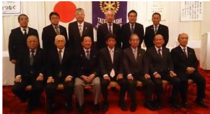
2020～21年度（第63代）役員及び理事