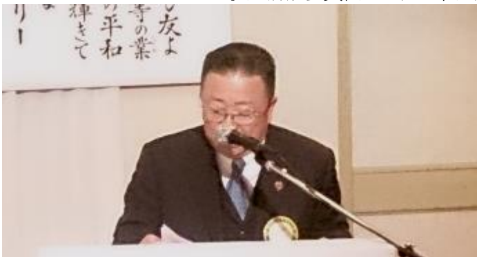
お誕生日（会員及びご夫人）（敬称略）