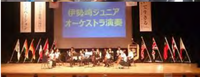
アトラクション 伊勢崎ジュニアオーケストラ