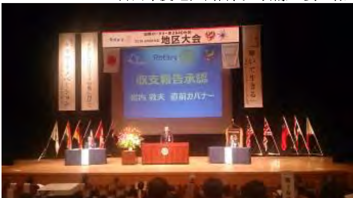
承認 直前ガバナー 宮内 敦夫 様