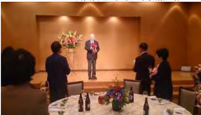
乾杯 直前ガバナー 宮内 敦夫 様