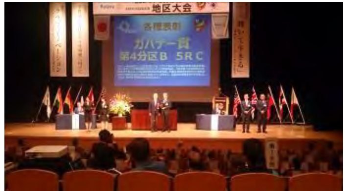
ガバナー賞 第4分区B 5RC