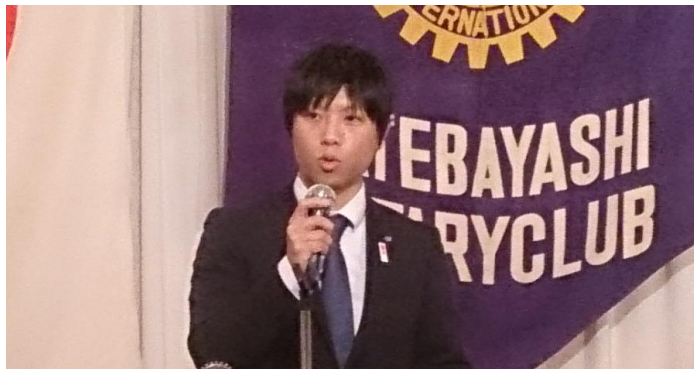
公益社団法人館林青年会議所 2020年度 第58代 理事長