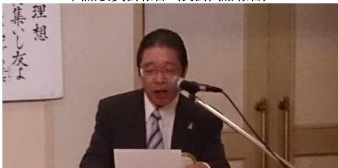
通算 3026 回例会