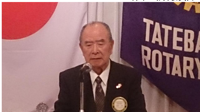
クラブ研修委員会 クラブ研修リーダー