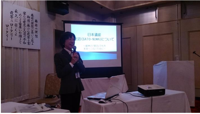
日本遺産プロジェクト 市史編さんセンター所長