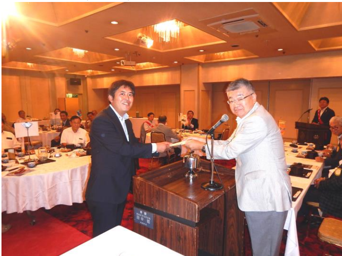
創立55周年記念 協賛金贈呈