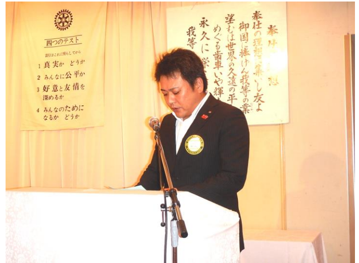
黄金色に輝く根岸委員長 (^◇^)

皆様の力を寄せ合い、一致団結し 歴史ある館林ロータリークラブを ますます増す盛り上げて参りましょう。