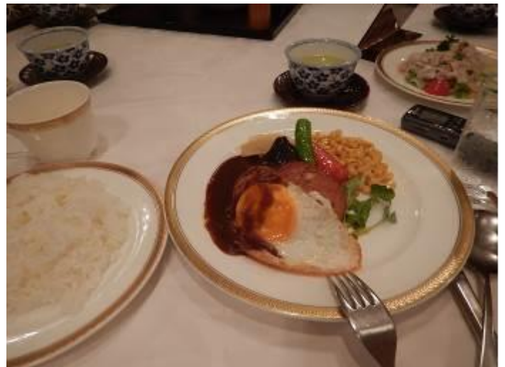
今日のお昼食です。ハンバーグ&目玉焼き