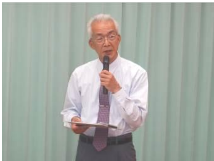
社会福祉法人全仁会