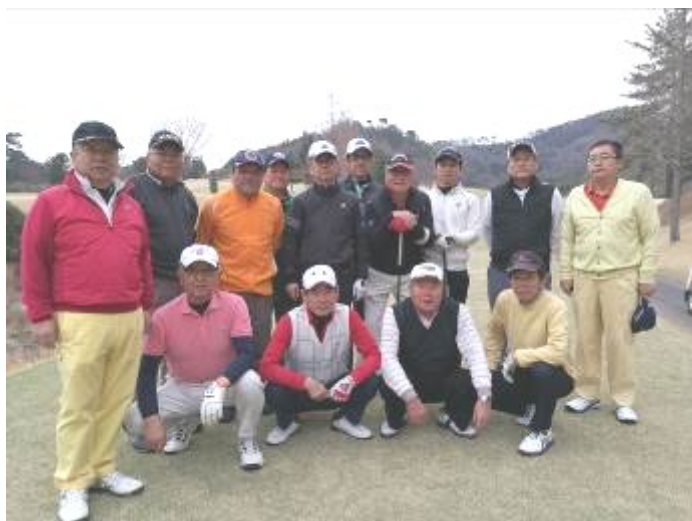
絶好のゴルフ日和(^o^)/唐沢ゴルフ倶楽部唐沢コース