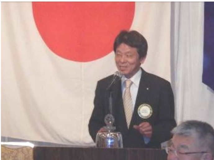
勝負に掛ける情熱を、熱く語って頂きました。