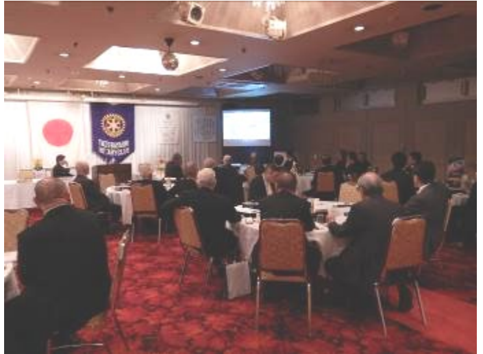
榎ワールドさん編集の大迫力の作品を 拳を握りしめ鑑賞しました。