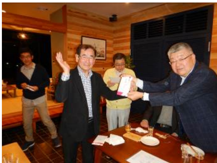
参加者全員に豪華商品券が渡り、皆ニコニコです。 (*^*)v(*^*)v(*^*)v