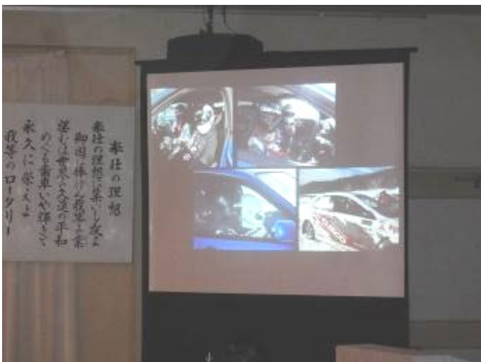
助手席に座り、共に走っているような臨場感！