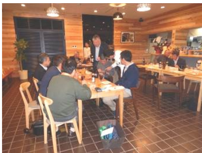
城町食堂での表彰式…美味しい料理とお酒で賑やかに楽しみました。ヽ(^。^)/