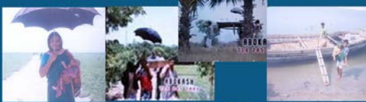
村では、歩行もしくはボート