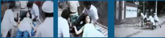
地方都市ー自転車もしくはリヤカー